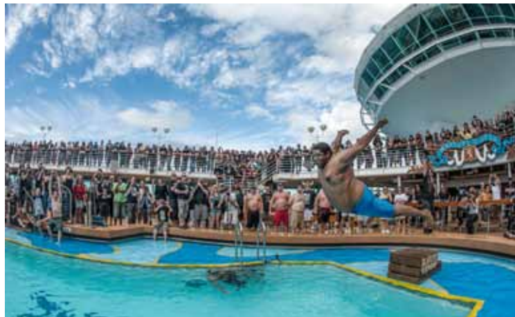
Kryssningen erbjuder även rekreation för hårdrocksfansen. Sångaren Dolk i det norska black metal-bandet Kampfar.