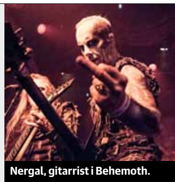
Nergal, gitarrist i Behemoth.

Bland dem som åker på Barge to hell och 70 000 tons of metal finns 40–50 olika nationaliteter, mest amerikaner, tyskar och kanadensare, men också många från Sverige och Finland. Ungefär en tredjedel är kvinnor, och hälften bokar in sig för en ny omgång följande år. Mer information finns på www.bargetohell.com och www.70000tons.com