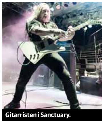
Gitarristen i Sanctuary.