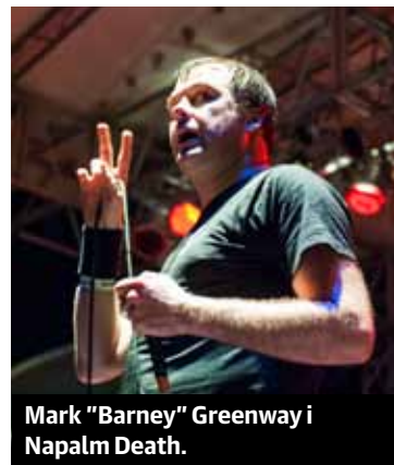
Mark "Barney" Greenway i Napalm Death.